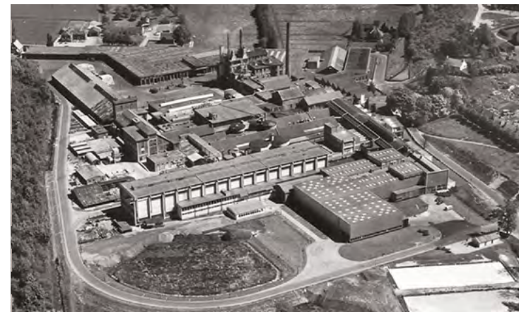
Het industrieterrein dat plaatsmaakte voor natuur

Hier stonden oorspronkelijk 4 watermolens waarvan 2 papiermolens. Waterkracht werd stoomkracht en de Renkumse papierindustrie werd steeds belangrijker. In de jaren 1950 was Van Gelder Papier de grootste werkgever van Renkum. Het industrieterrein blokkeerde echter een belangrijke natuurlijke verbinding tussen de Veluwe en de Nederrijn. Edelherten en dassen, maar ook insecten en reptielen konden niet langer van de droge zandgronden van de Veluwe via het Renkums Beekdal naar de voedselrijke natte uiterwaarden trekken. Rijk en provincie financierden een uniek natuurherstelproject. Er zijn 19 bedrijven verplaatst. Na de sloop, sanering van de vervuilde grond en het verwijderen van munitie uit de Tweede Wereldoorlog, werd het natuurgebied ingericht. De beken stromen nu weer bovengronds af naar de Nederrijn en de natuur ontwikkelt zich razendsnel.