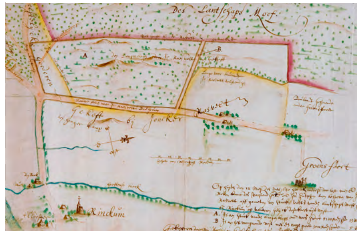
Kaart uit de 17de eeuw met kasteel Grunfoort, de plek van het huidige Oranje Nassau's Oord en de Moft (een groot bosgebied van de hertogen van Gelre)