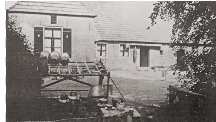
Melkbussen van boerderij Everwijnsgoed (nu De Beekdalhoeve) aan de rand van de Oliemolenbeek

In het Renkums Beekdal stromen diverse beken richting de rivier. Sprengenbeken zijn met de hand gegraven tussen 1570 en 1800. Ze leverden energie voor het aandrijven van watermolens. In de papiermolens werd een deel van het schone beekwater gebruikt voor de papierfabricage. Een sprengenbeek ontspringt in een sprengkop: een tot op het grondwater gegraven bron. Het grondwater borrelt hier omhoog. Door het natuurlijke hoogteverschil op de Veluwe stroomt het water naar beneden door de sprengenbeek. Deze liet men langzamer aflopen dan het beekdal zelf. Waar de beek hoger ligt, werd de bodem bekleed met leem om te voorkomen dat het water wegzakte. Bij ongeveer twee meter hoogteverschil bouwde men een watermolen. Van de 9 watermolens in het beekdal is alleen de Quadenoordse Molen over. Deze is in 2021 volledig hersteld tijdens de reconstructie van een beeklandschap. Vrijwilligers van IVN werkgroep 'Beken en sprengen' onderhouden met het waterschap de beken en sprengen.